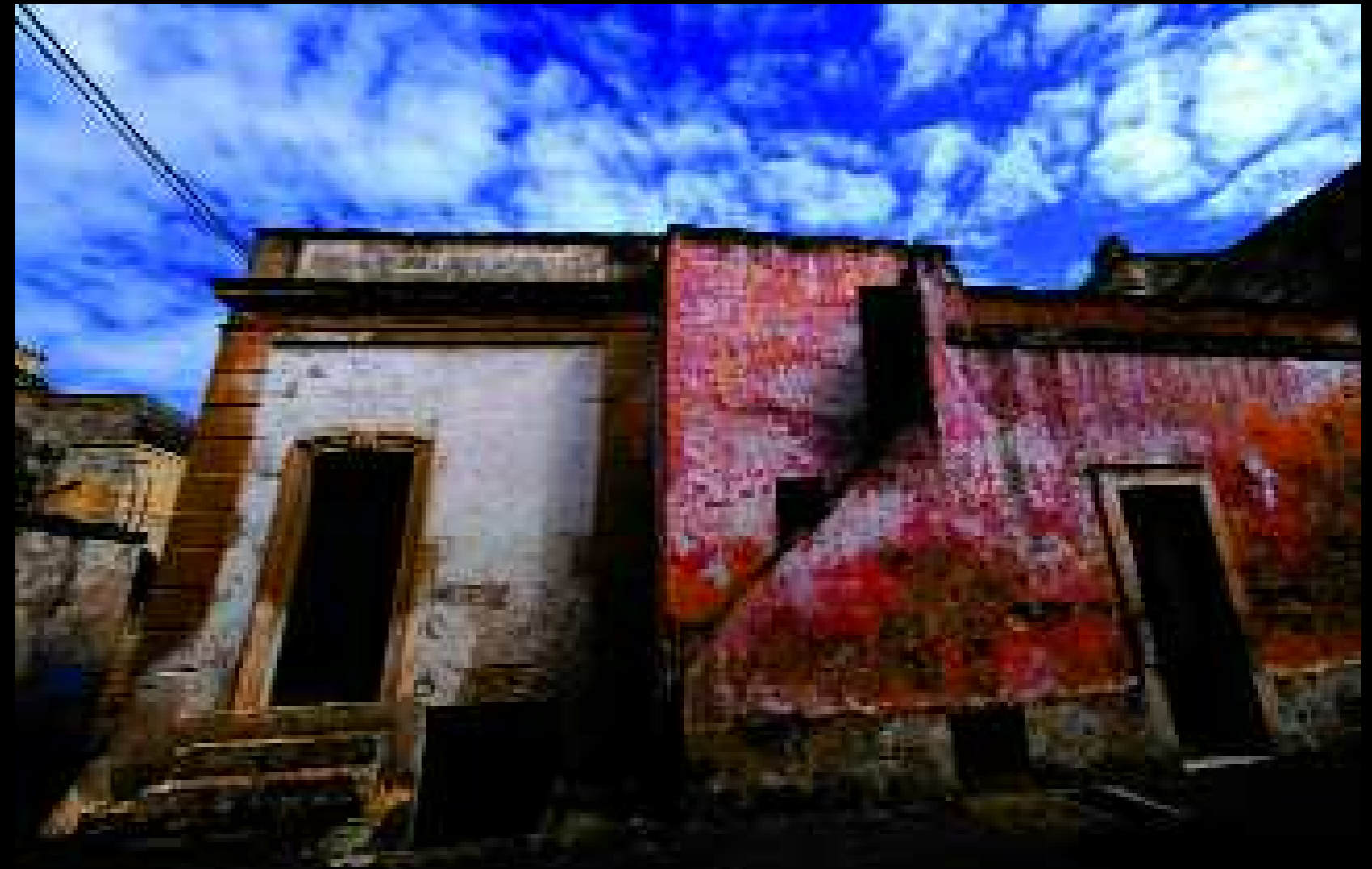
Castro 1, 2009

Ma per raccontare la vita e la morte si deve imparare a parlare con le ombre, si deve abituare lo sguardo a spostarsi dal basso per l'alto, a cercare lo spiraglio di luce nel buio più fondo.