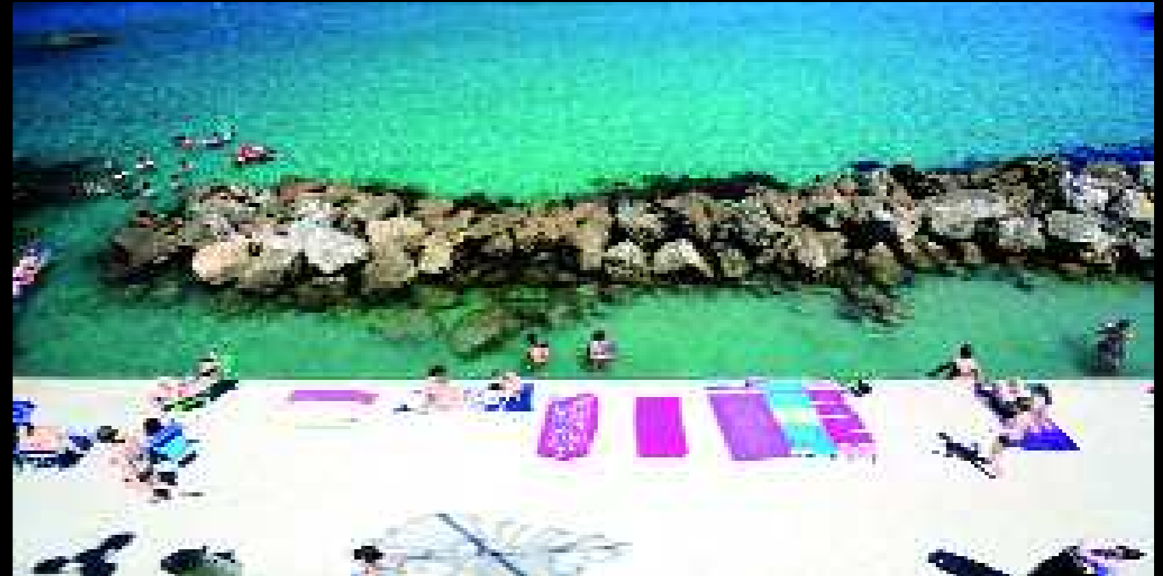
Otranto 7, 2008

all'attesa che quello che non è stato possa ancora essere, un giorno o l'altro, prossimo o lontano.