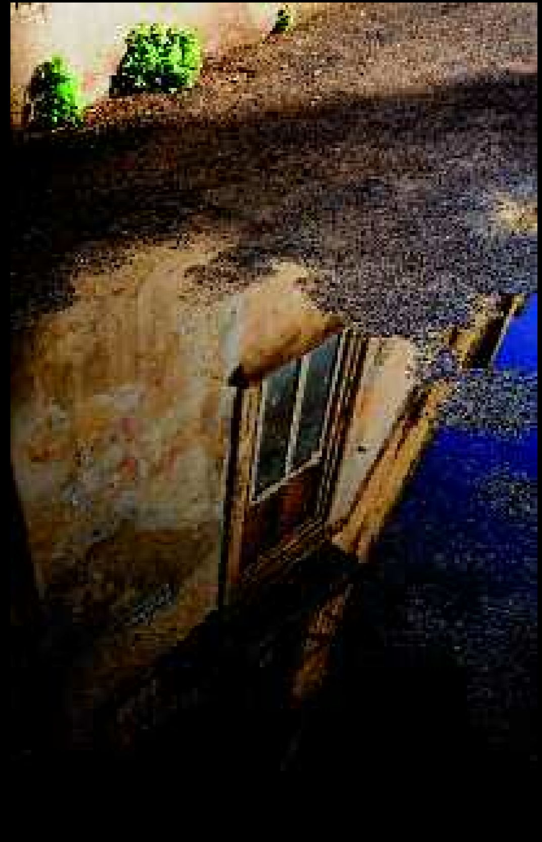
Lecce 33, 2009