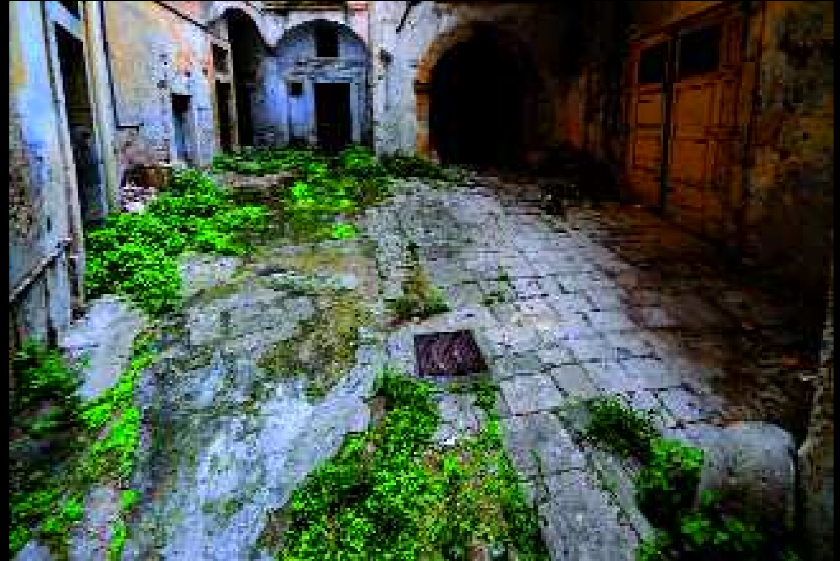
Galatina 4, 2008

Questo vorremmo, per consolatoria illusione.