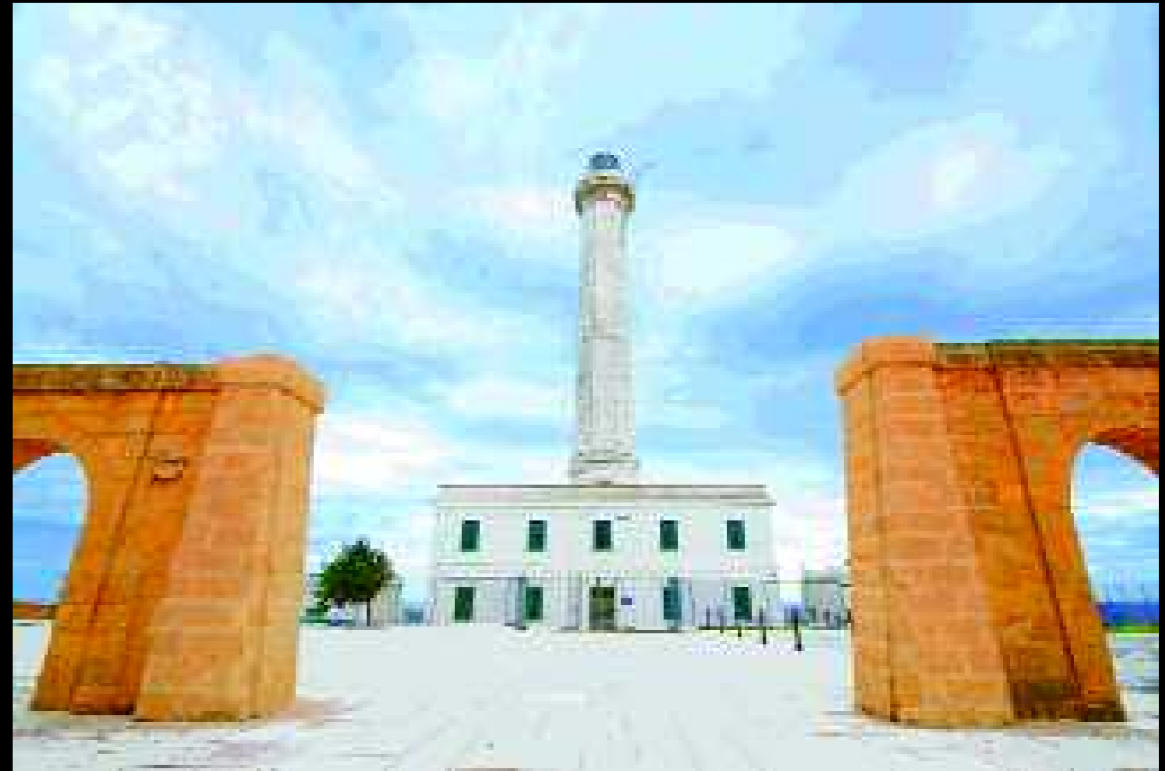
Leuca 1, 2009

Allora il senso estremo, assoluto, probabilmente è tutto nel rispecchiamento del sentimento che si prova nei confronti della propria vita con quello che si prova nei confronti della propria terra. Il senso sta nel sentire dentro una condizione di continuità con il passato e di attrazione per il futuro. Sta nel racconto che cerca, parola per parola, immagine per immagine, di rassomigliare ad un tronco macerato da un fulmine, oppure ad una nuvola che nasconde la luna, o ad un rivolo di pioggia che scorre lungo il marciapiede, ad una leggenda, una rabbia per la storia, un riscatto dalla marginalità della geografia, alla malinconia per tutto quello che sarebbe potuto essere e non è stato,