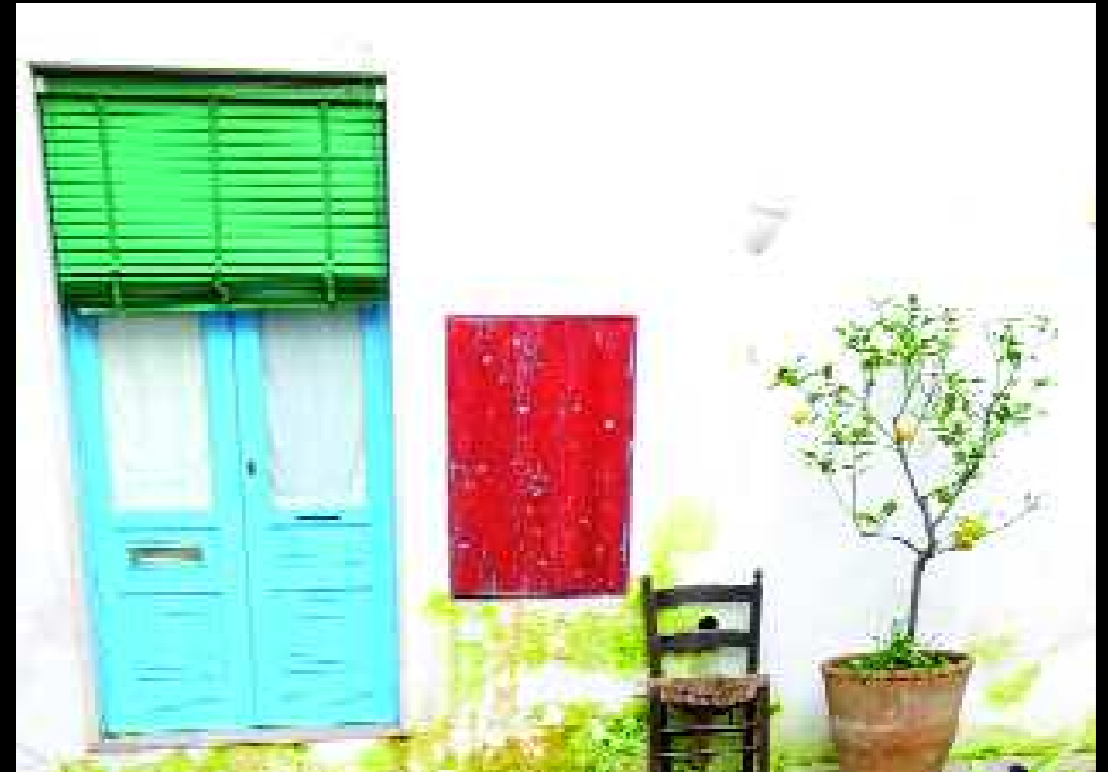
Presicce 6, 2009

La scoperta di questa compenetrazione con la terra è una sensazione che svuota, che fa girare il sangue nella testa. Il processo di riconoscimento e di rispecchiamento trova la sua condizione in uno sbalordimento, in un abbandono totale; la comprensione del proprio essere nel mondo e per il mondo che coincide esattamente con il luogo dell'origine, della provenienza, può avvenire solo per amore. Non con l'arte, la ragione. Solo per amore.