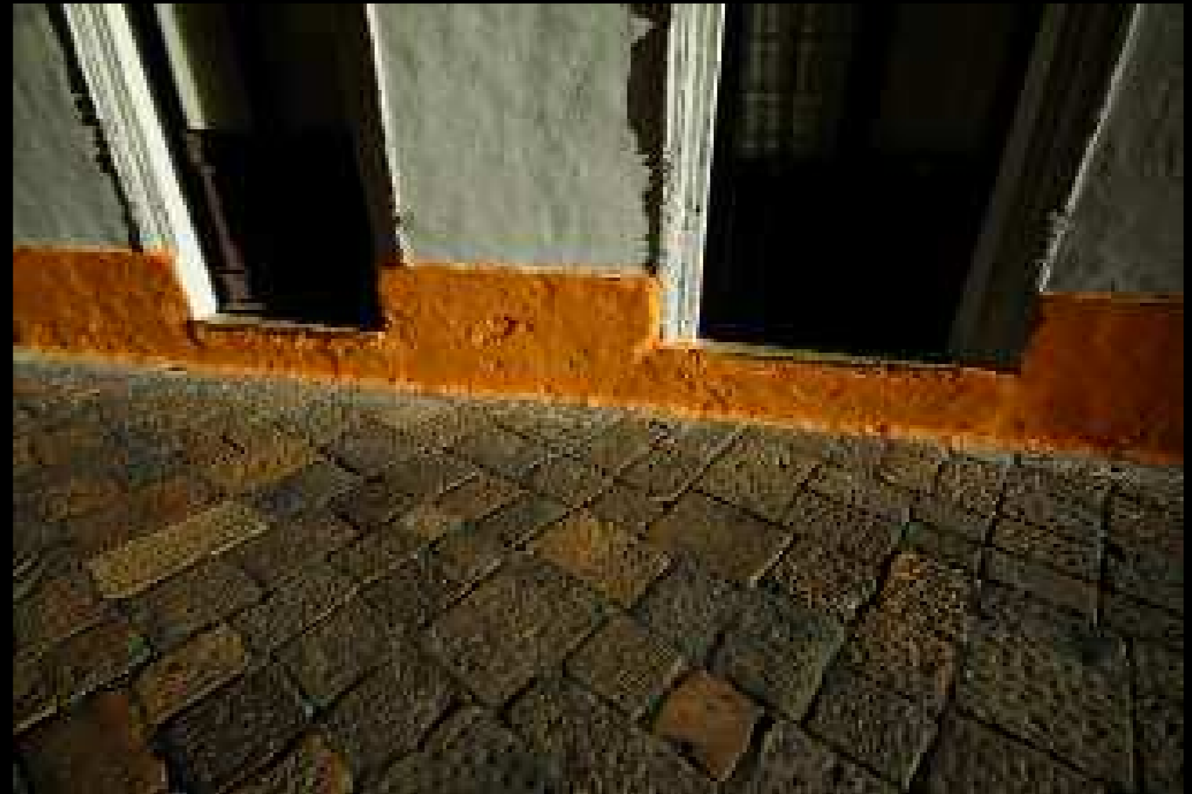
Gallipoli 3, 2008