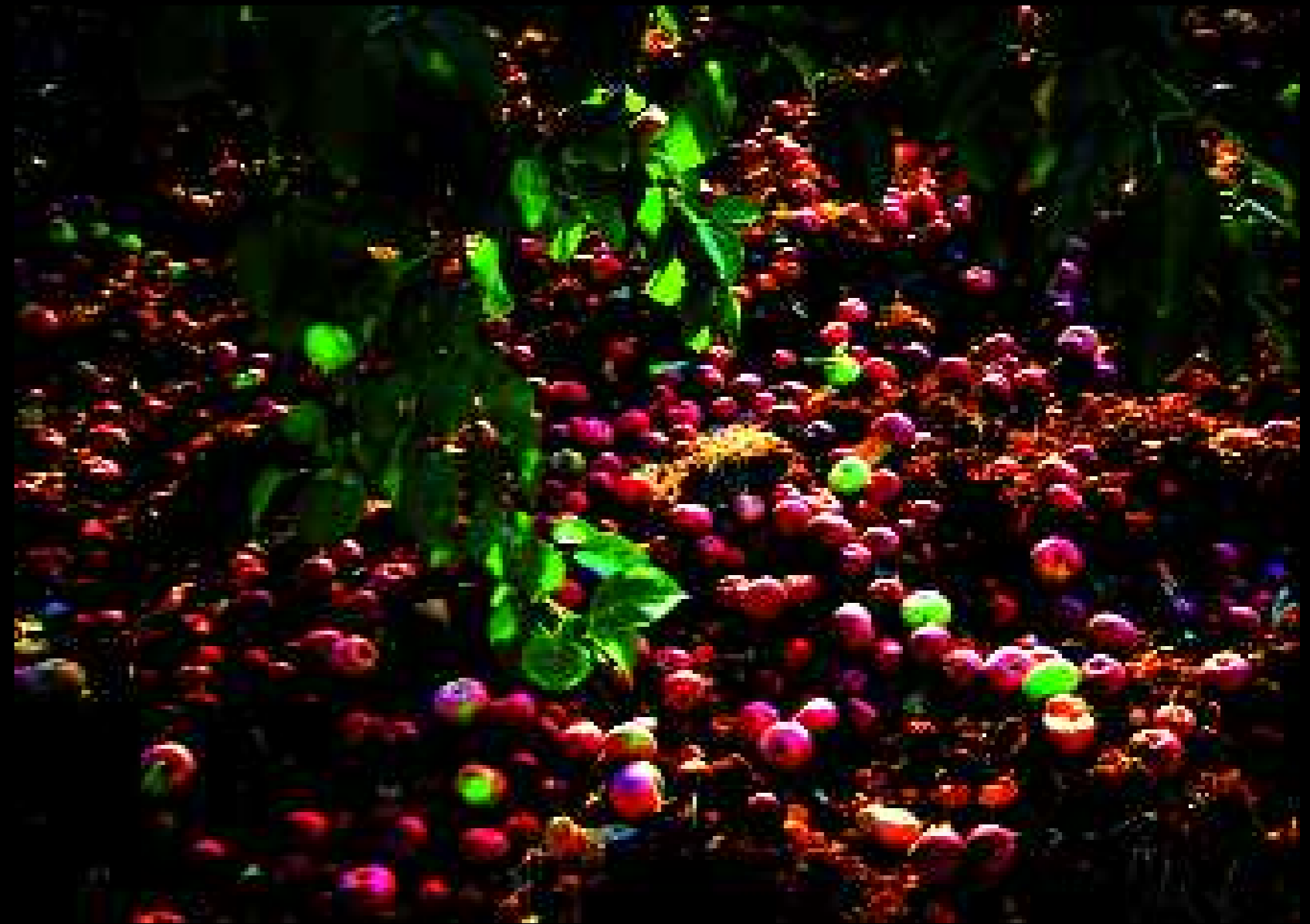
Melendugno 2, 2008