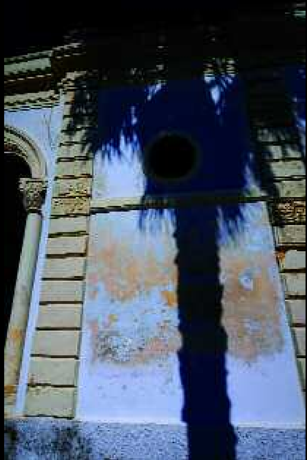
Porto Cesareo 2, 2008