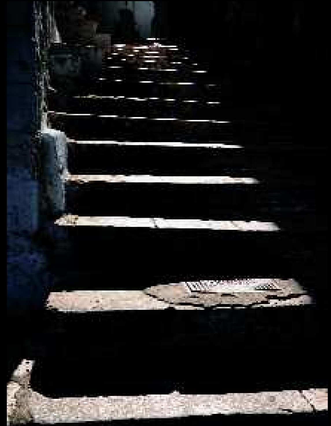
Ostuni 5, 2008

Qui, quello che adesso conta è immateriale. Come quando un vento dilaga tra le stoppie. Come una preghiera dietro un uscio rinserrato. Come quando un chiarore di stella oscilla sulle scale di case abbandonate per chissà che fughe solitarie oppure che tem- peste di ricordi.