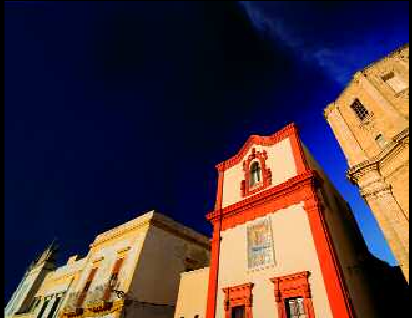
Gallipoli 4, 2008

tra il nostro desiderio di consegnarlo ad una figurazione immutabile e il suo trasformarsi continuo, la sua mutazione incessante, il suo proiettarsi lontano.