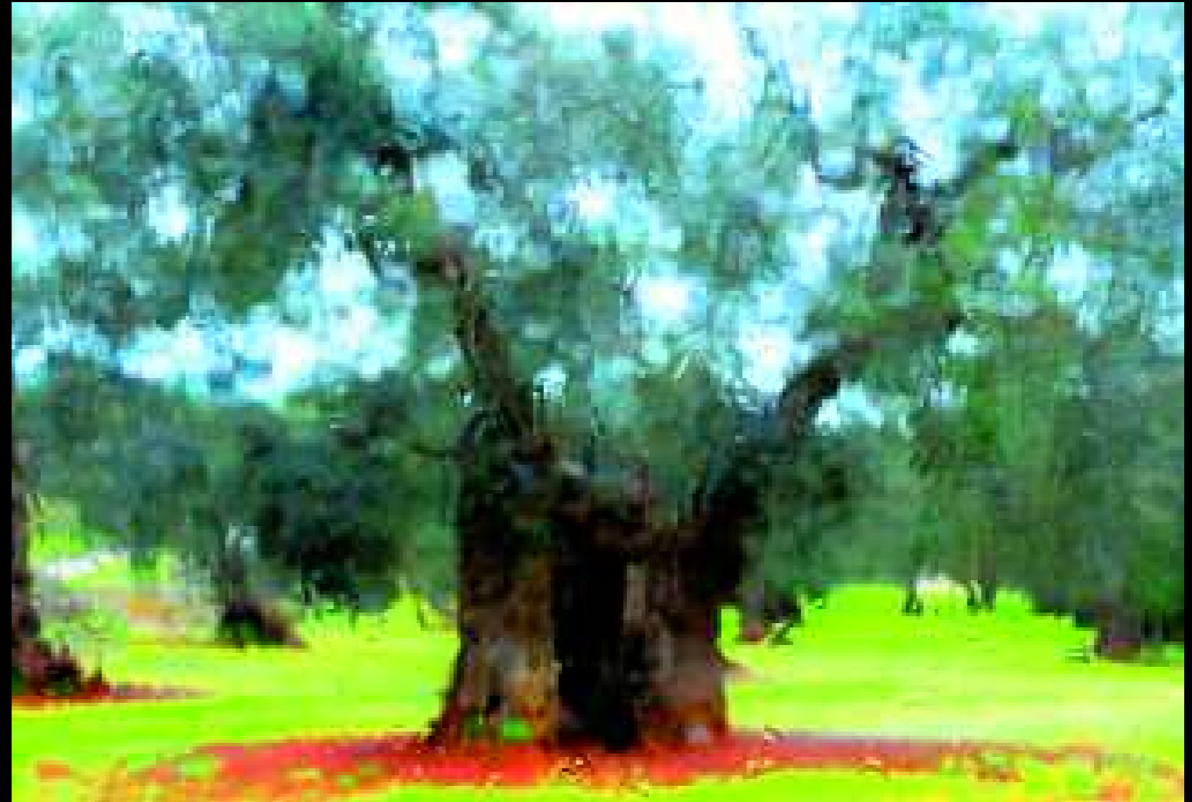
Salve 3, 2009

Secoli fra gli ulivi, forse non siamo altro che amanuensi “di quanto nei secoli è nostro per transito umano, da prima che nascessimo e nelle generazioni dei figli, nostro da sempre e per un attimo nel tempo fra gli ulivi dal quale venimmo.