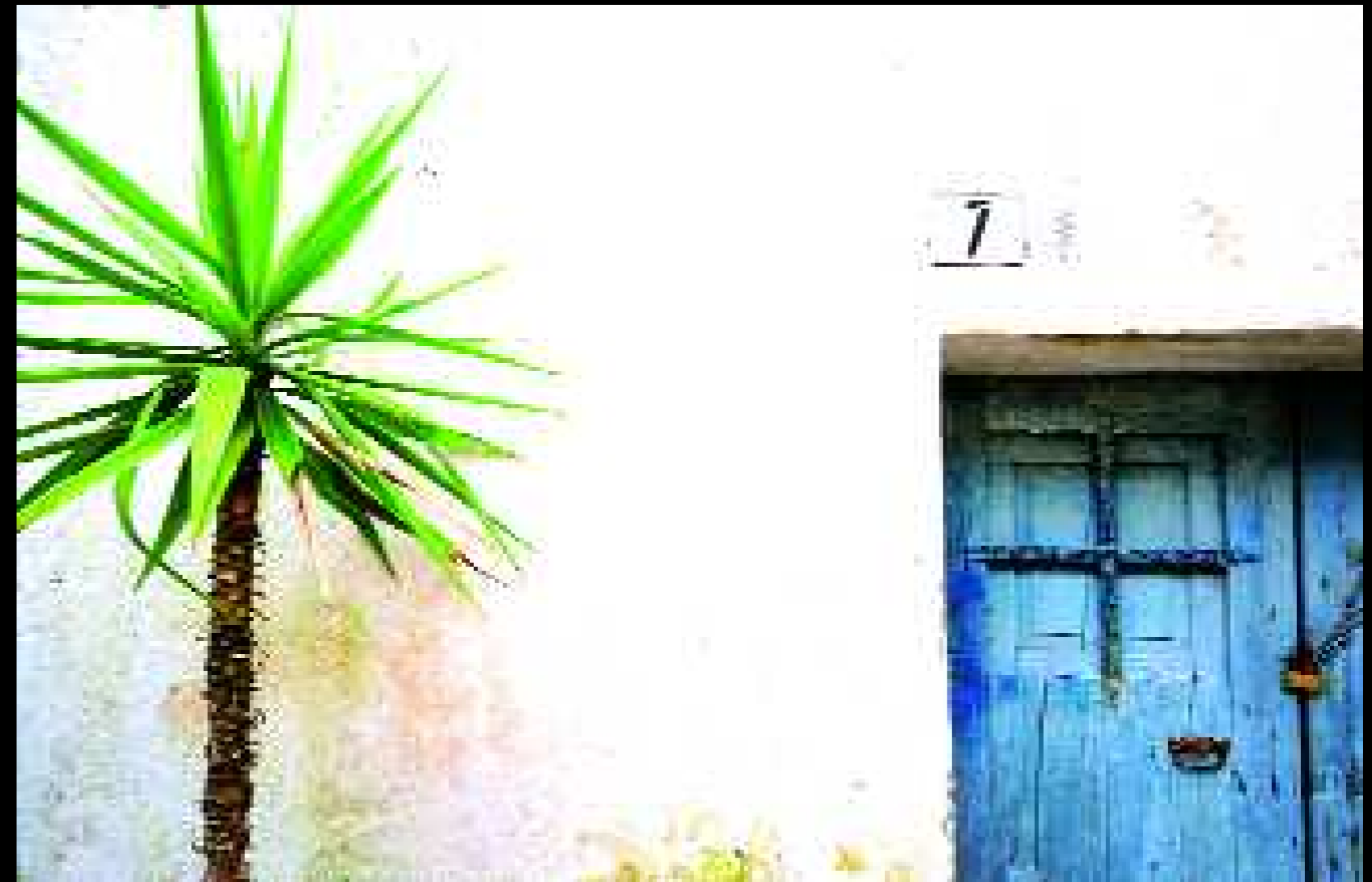
Presicce 10, 2009

Nell'altro che gli appare come una figura proveniente dal tempo indefinito, Antonio Galateo trova la propria autentica identità, una precisa fisionomia esistenziale, una appartenenza che sente sulla pelle, un “improvviso fremito” che gli riempie il sangue.