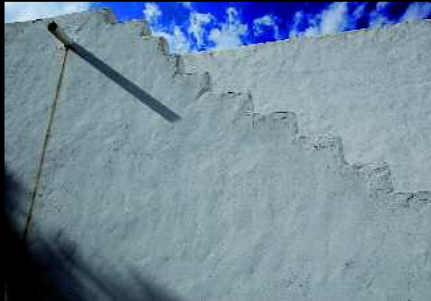
Felline 2, 2008