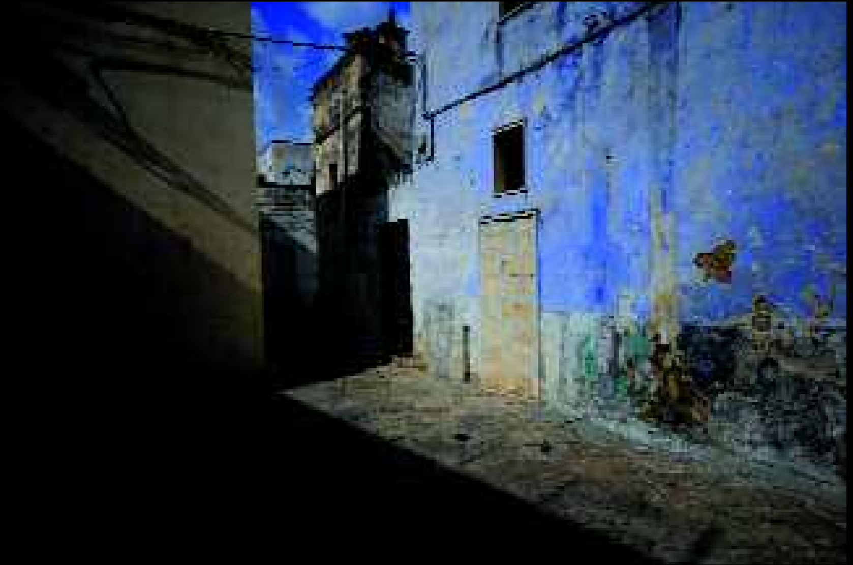
Copertino 2, 2008

Raccontare la vita e la morte con i colori dei fiori sui rami, con il bianco denso di un fumigare di sterpaglie, con la sola presenza dell'Uomo e delle Donne che rinnovano il calvario.