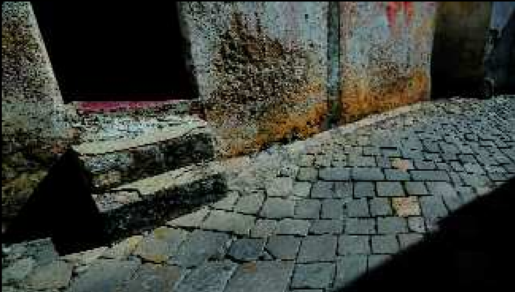
Nardò 1, 2008