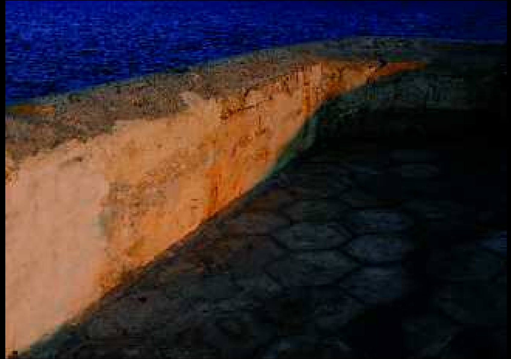
Gallipoli 10, 2008