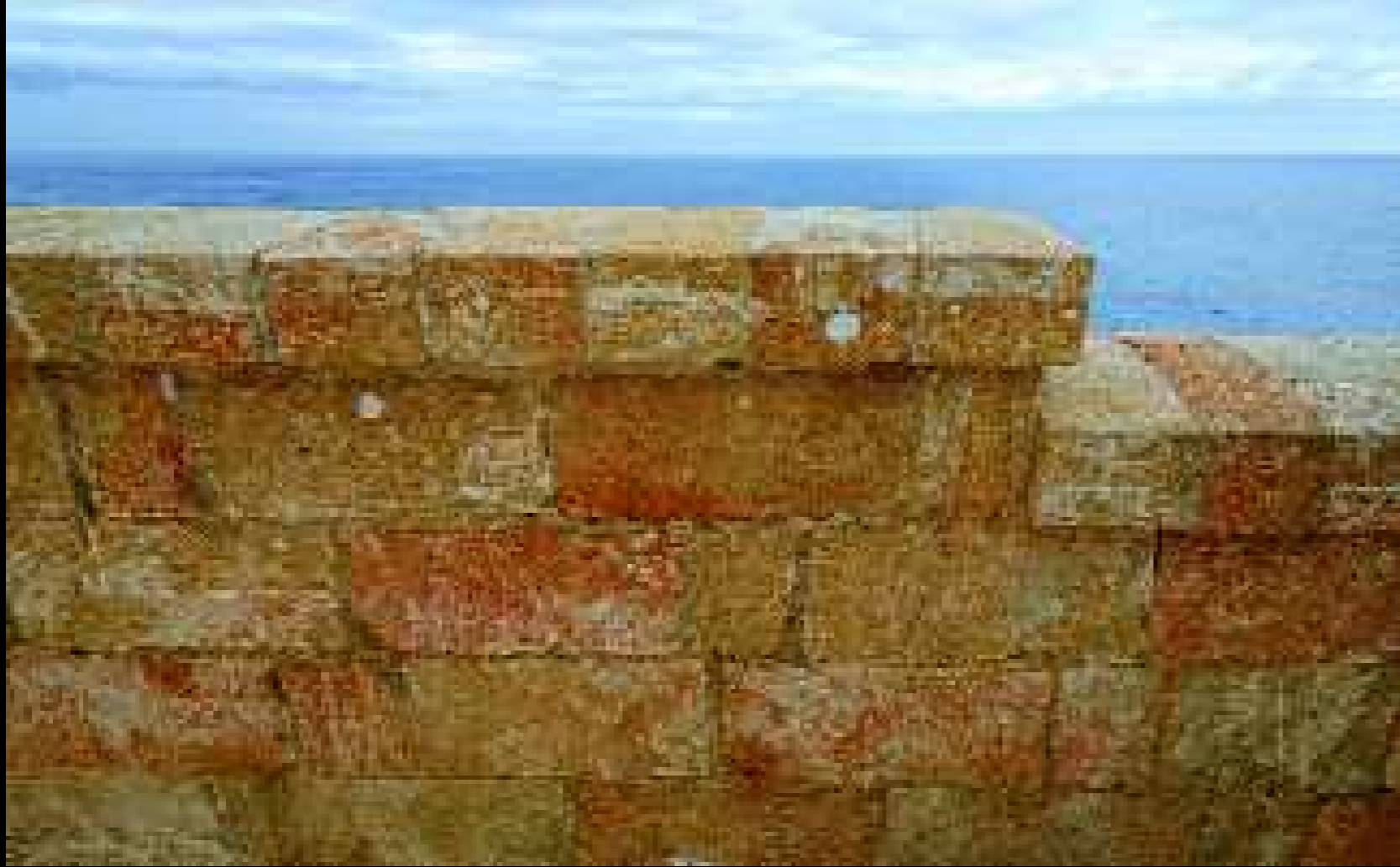
Leuca 1, 2009