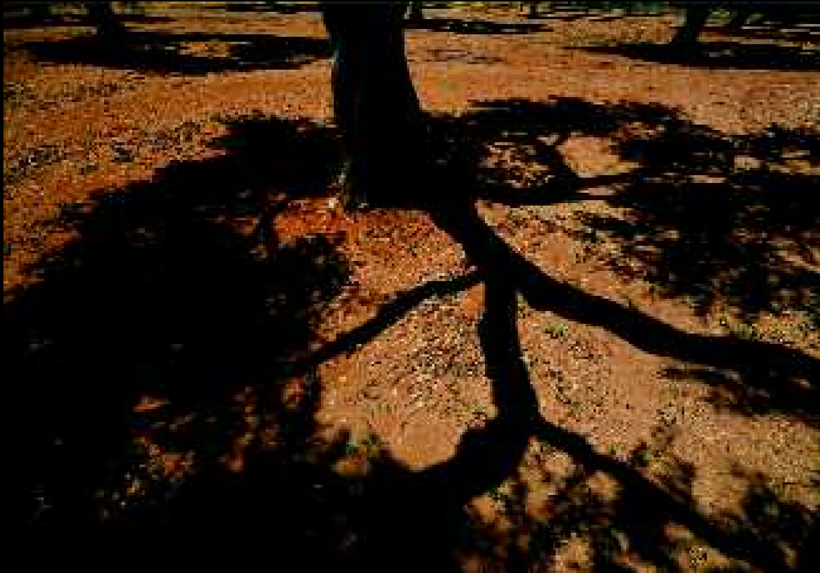
Borgagne 4, 2008