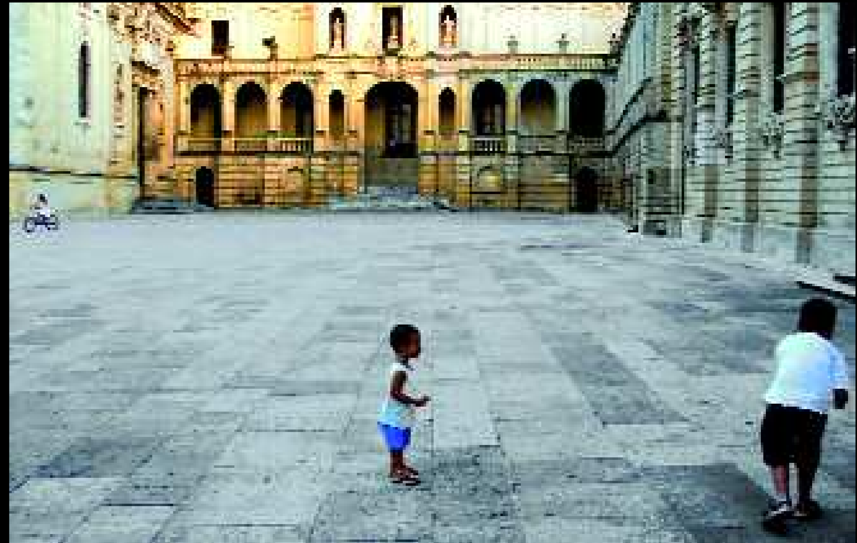
Lecce 5, 2008

Vorremmo essere solo noi ad avere nostalgia. Di questo luogo siamo gelosi come lo siamo di chi amiamo. Così tentiamo di farci dare in dono l'anima. Oppure di rubar- gliela. Ma chiediamo in dono, o rubiamo, quella condizione che non sappiamo bene cosa sia.