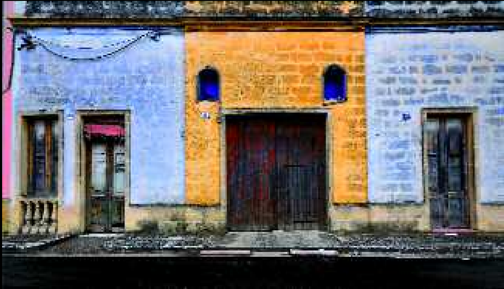
Noha 6, 2008