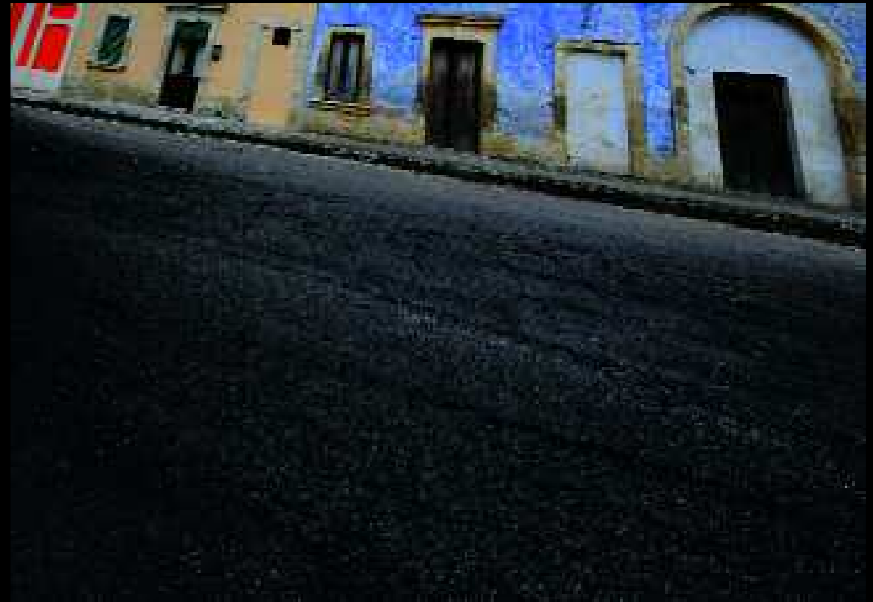
Noha 7, 2008

Il racconto di questo luogo si fonda sul senso determinato dai contrasti: un sentimento o una condizione di prossimità e di lontananza; il rifiuto del presente e l'attrazione del passato; il confronto con la concretezza e il desiderio di indeterminato, di irrazionale, di magico.