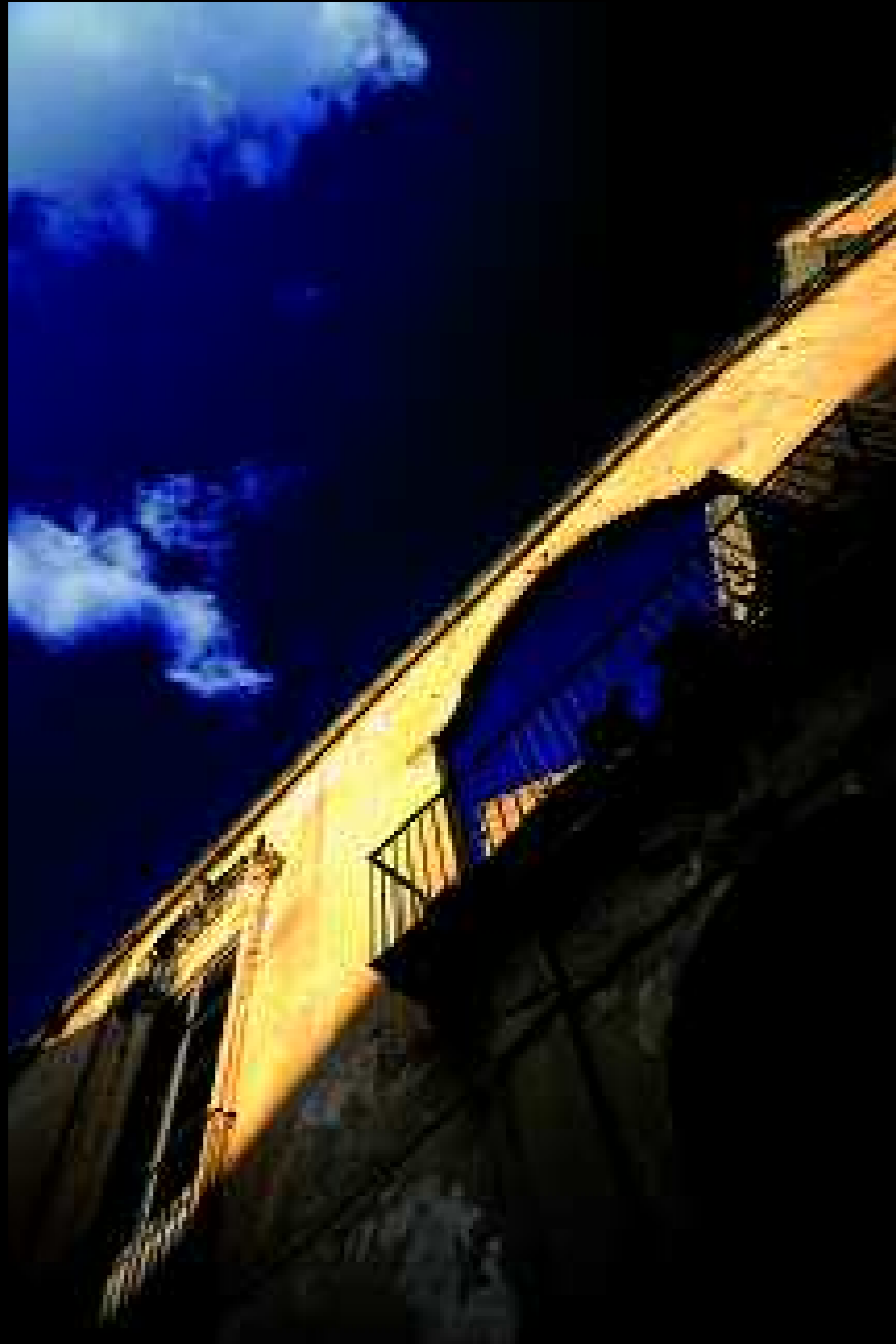
Lecce 31, 2009