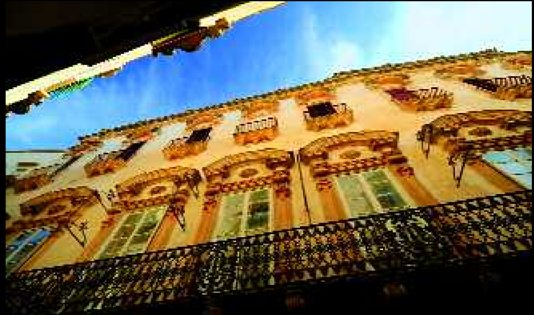
Gallipoli 1, 2008