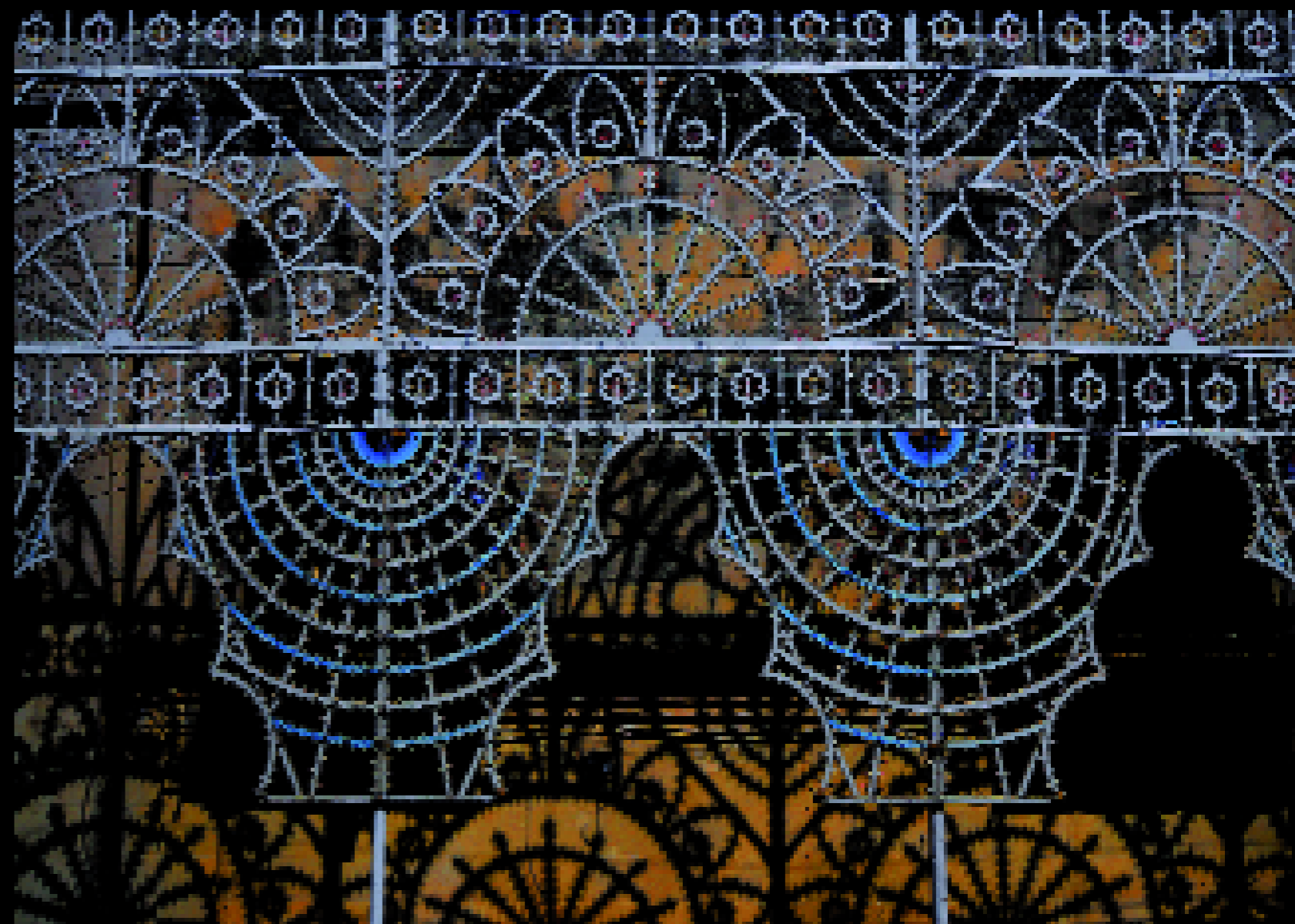
Melendugno 1, 2008

Qui è come se i luoghi tentassero di resistere all'assedio di un presente che si fa sempre più straniero, che ruba lo splendore del passato, che rinnega il senso profondissimo, interiore, della terra, il suo mistero, l'incognita dell'essere sospesi tra le sponde e le correnti di due mari, incantati da orizzonti che hanno colorature uniformi, che aprono e stringono distanze, che si condensano nelle nuvolaglie o si distendono in pianure di cielo azzurro, sconfinato.