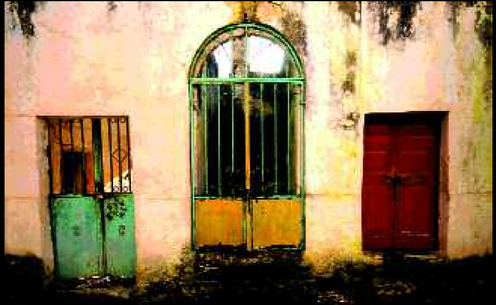
Presicce 5, 2009