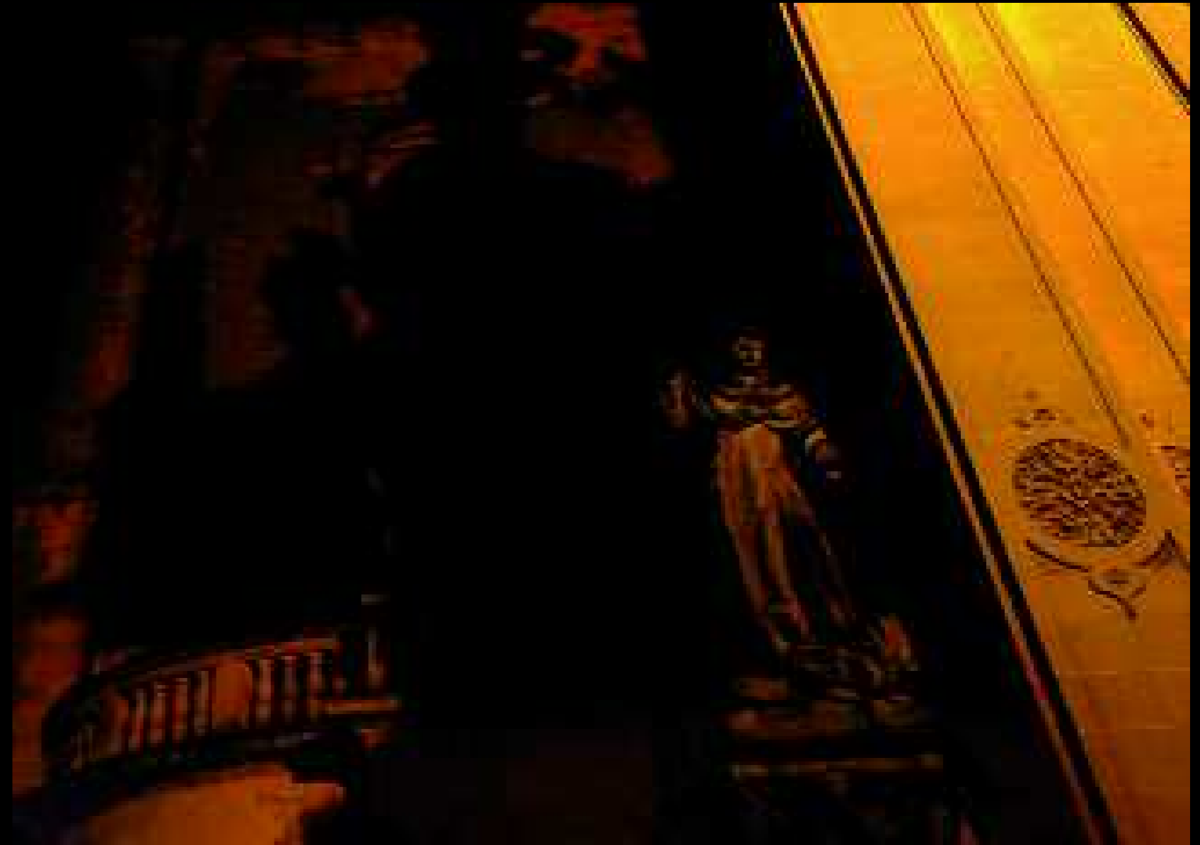
Lecce 13, 2009

Chi racconta di questo luogo deve riconoscersi: riconoscere il sé che si è conformato nel transitare delle stagioni, identificarsi in un paese originario che ha la fascinazione di un dove e di un altrove, che genera, quasi simultaneamente, un movimento di fuga e uno di ritorno che molto spesso costituiscono il motivo o il movente del racconto.