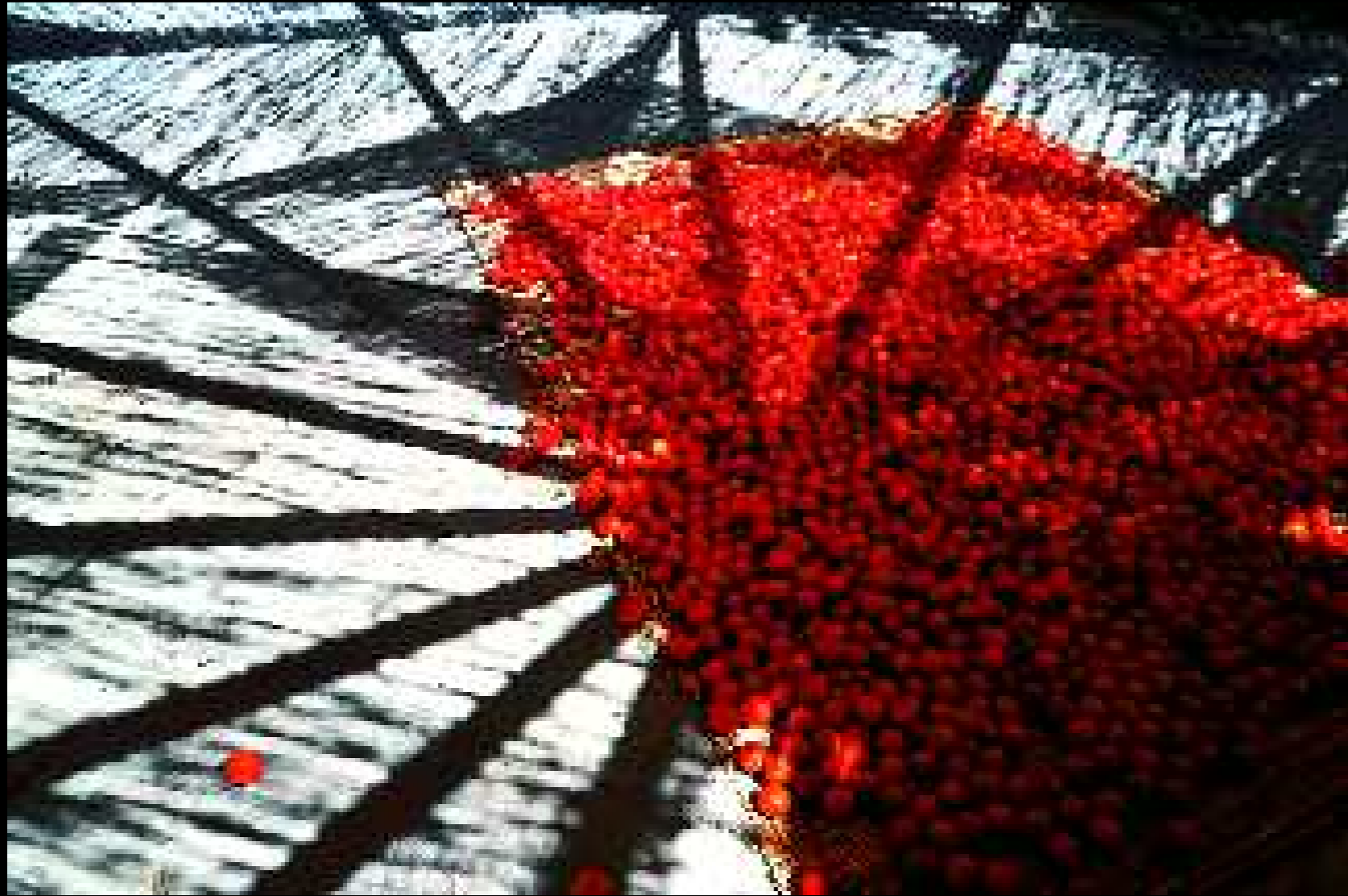
Borgagne 3, 2008