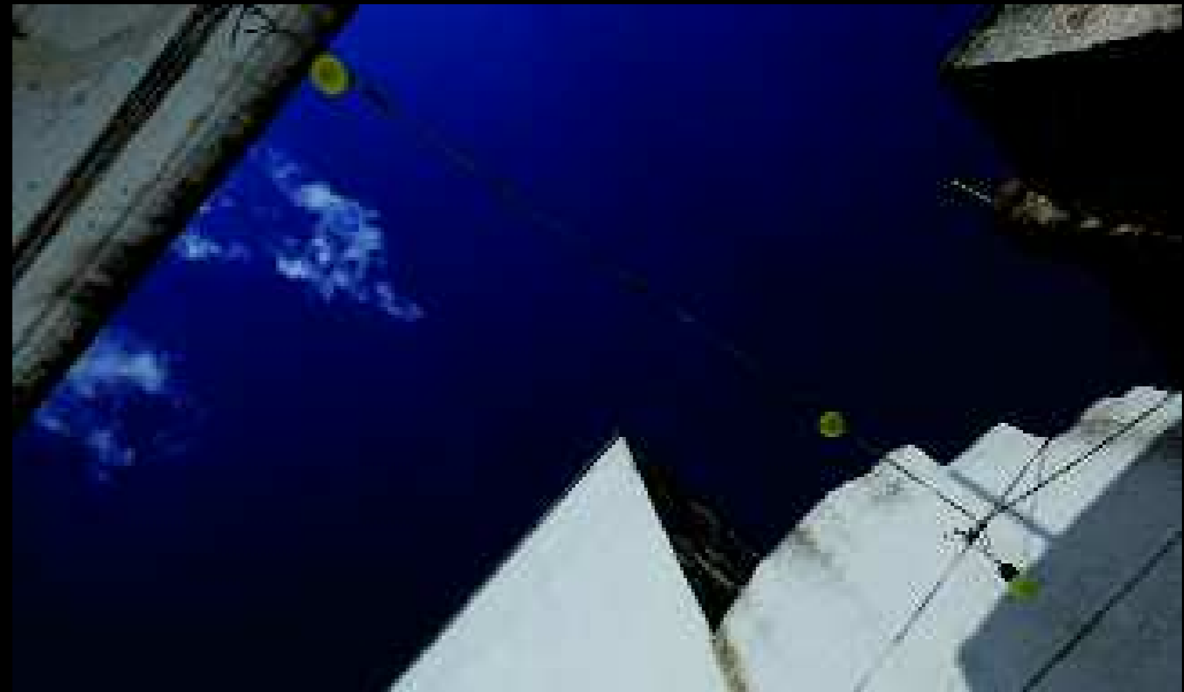
Felline 1, 2008

Raccontare questo. Anche come mistura di verità e di menzogna, concretezza e astrazione, anche in quelle condizioni che, per natura, non si possono narrare, non si possono figurare, non si possono rappresentare.