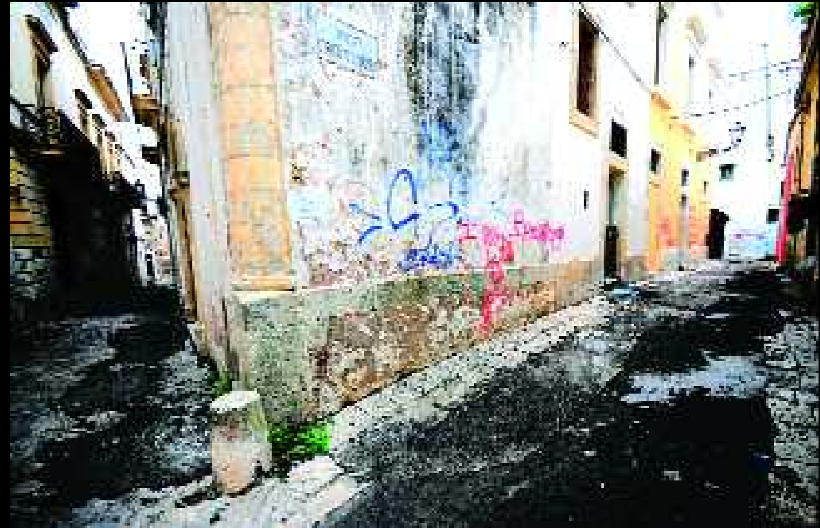
Galatina 2, 2008

Perché, qui, si cova l'arrogante pretesa di raccontare la vita e la morte, come sacerdoti del quotidiano o poeti frastornati dalla luna che talvolta sembra attirare ogni pensiero al modo in cui attira le maree.