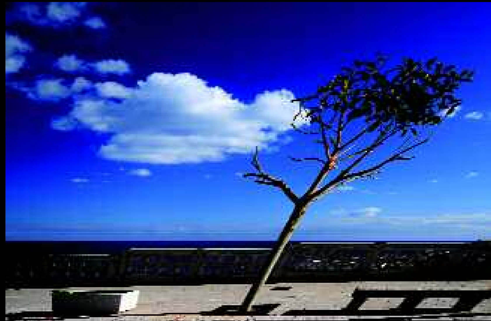
Santa Cesarea 2, 2009

Questo luogo dice che c'era prima che noi ci fossimo e che ci sarà anche quando noi non ci saremo più. Cambierà. Diventerà un altro luogo rispetto a quello che ora è. Forse è per questo che comincia la sfida: tra le parole e un tramonto, tra il colore e un intrico di rovi, tra la screpolatura di un muro e lo sguardo di una fotografia. Perché non ci rassegniamo che possa essere soltanto quello che è; vogliamo – pretendiamo – che sia fatto a nostra immagine e somiglianza.