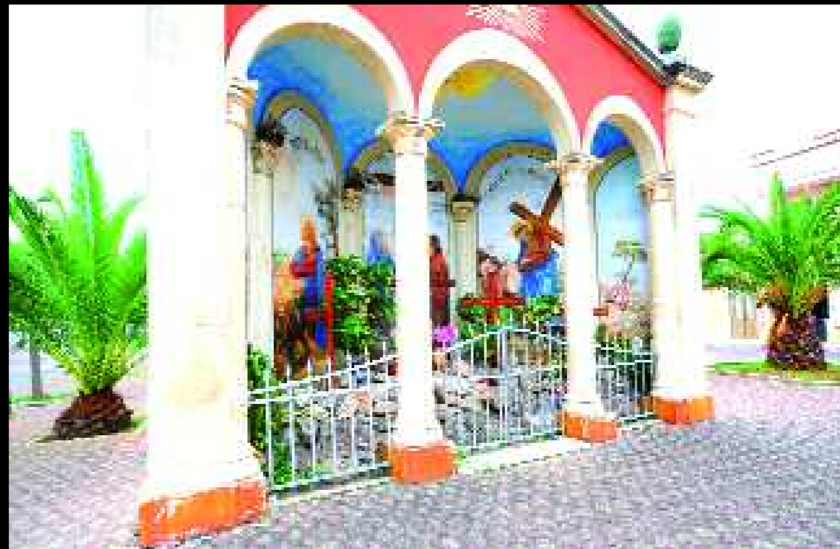
Noha 1, 2008

Chi racconta di questo luogo deve muovere costantemente lo sguardo dal proprio esistere fisico, storico, emozionale, a quello del luogo reale o immaginato, alla sua storia, alle sue leggende, alle sue espressioni visibili e a quelle che appartengono alla sua physis e alla sua poesia, alle sue figure e alle ombre che da queste si staccano, si slargano, si spandono. Deve tener conto dei vivi e dei morti, delle bestemmie e delle preghiere che l'hanno attraversato e l'attraversano, dei bordelli e dei luoghi di pena, delle sue miserie e dei suoi riscatti, degli angeli che lo proteggono e dei demoni che lo insidiano. Deve tener conto dei suoi miti poveri o sontuosi, perché in modo esplicito o implicito, elaborano le forme del pensiero.